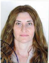
портрет на притекателя